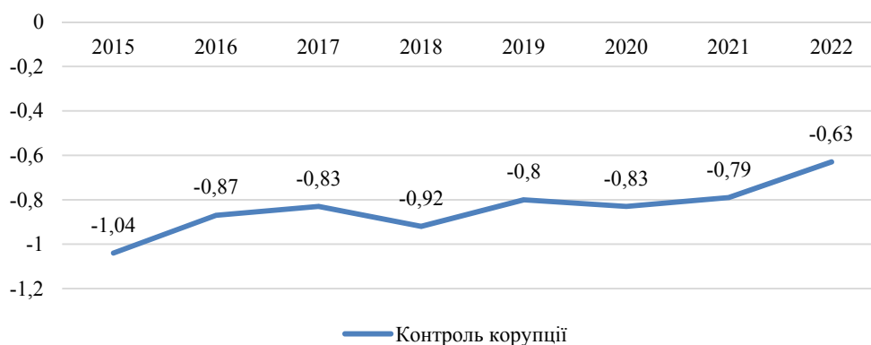
Рис. 3. Динаміка показника контролю корупції України за 2015-2022 роки

Джерело: побудовано автором за сценаріями із [15]